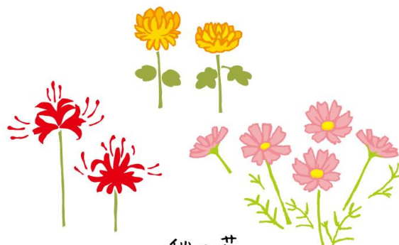
秋の花 Fall flowers